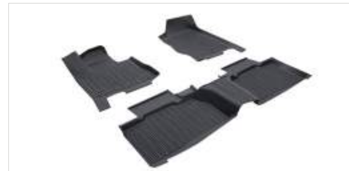
Dywaniki podłogowe, gumowe przednie i tylne (2 328 965) 1 066 zł