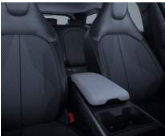
Tapicerka dostępna w pakiecie Comfort

Wyposażenie opcjonalne dla wersji Style i Explorer