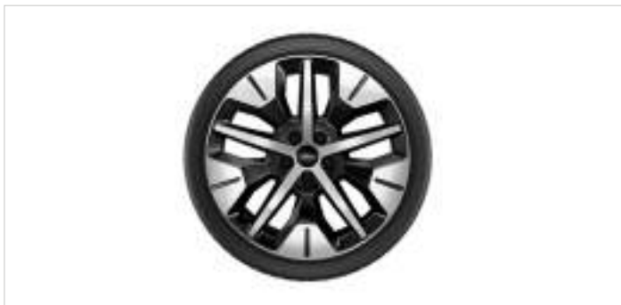
19" koła zimowe z czujnikami ciśnienia Opony Nokian Snowproof 2 SUV, 235/55 R19 105 V XL (2 712 263) 10 036 zł (komplet 4 sztuki)