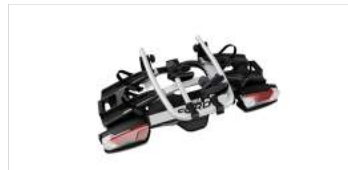
Thule®* Mocowany z tyłu pojazdu bagażnik rowerowy (2 353 442) 3 100 zł