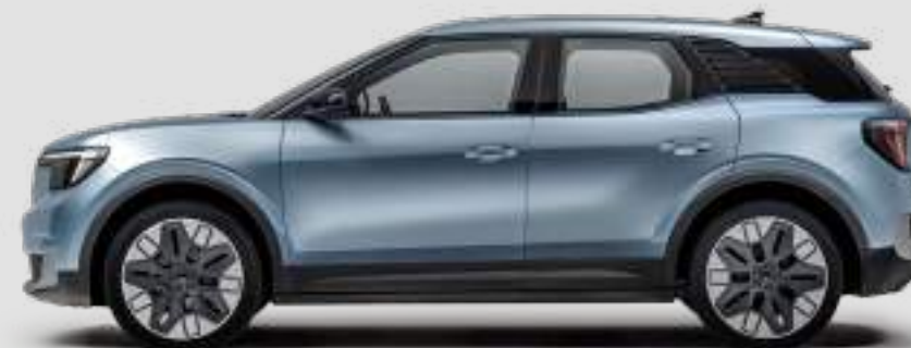
Długość całkowita 4468 mm

Pomiar zgodnie z normą ISO 3832. Rzeczywiste wymiary mogą się różnić od podanych wartości w zależności od wersji i wyposażenia. Wszystkie podane wyżej wartości są danymi fabrycznymi.