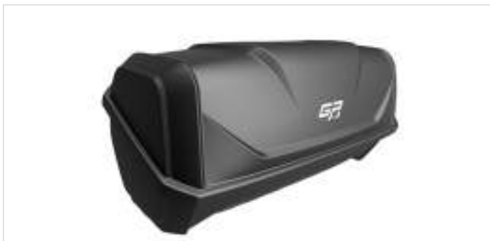
Bagażnik mocowania na haku holowniczym (2 831 824) 2 784 zł