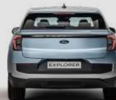
Szerokość całkowita z lusterkami bocznymi: 2063 mm