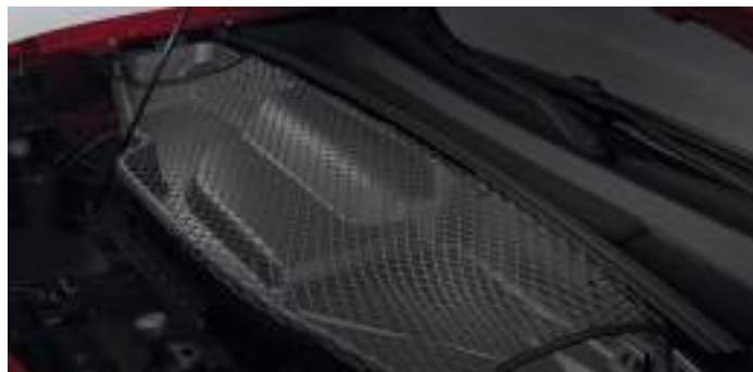
Organizer do bagażnika przedniego (2 825 614) 699 zł